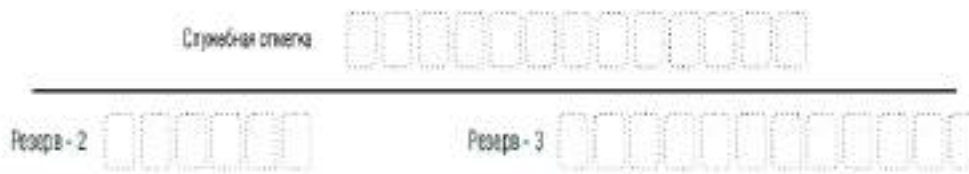
Рис. 5. Поля для служебного использования

Заполнение полей (рис. 6) организатором в аудитории обязательно, если участник экзамена удален с экзамена в связи с нарушением Порядка или не завершил экзамен по объективным причинам. Отметка заверяется подписью организатора в специально отведенном для этого поле бланка регистрации, и вносится соответствующая запись в форме ППЭ-05-02 «Протокол проведения экзамена в аудитории».