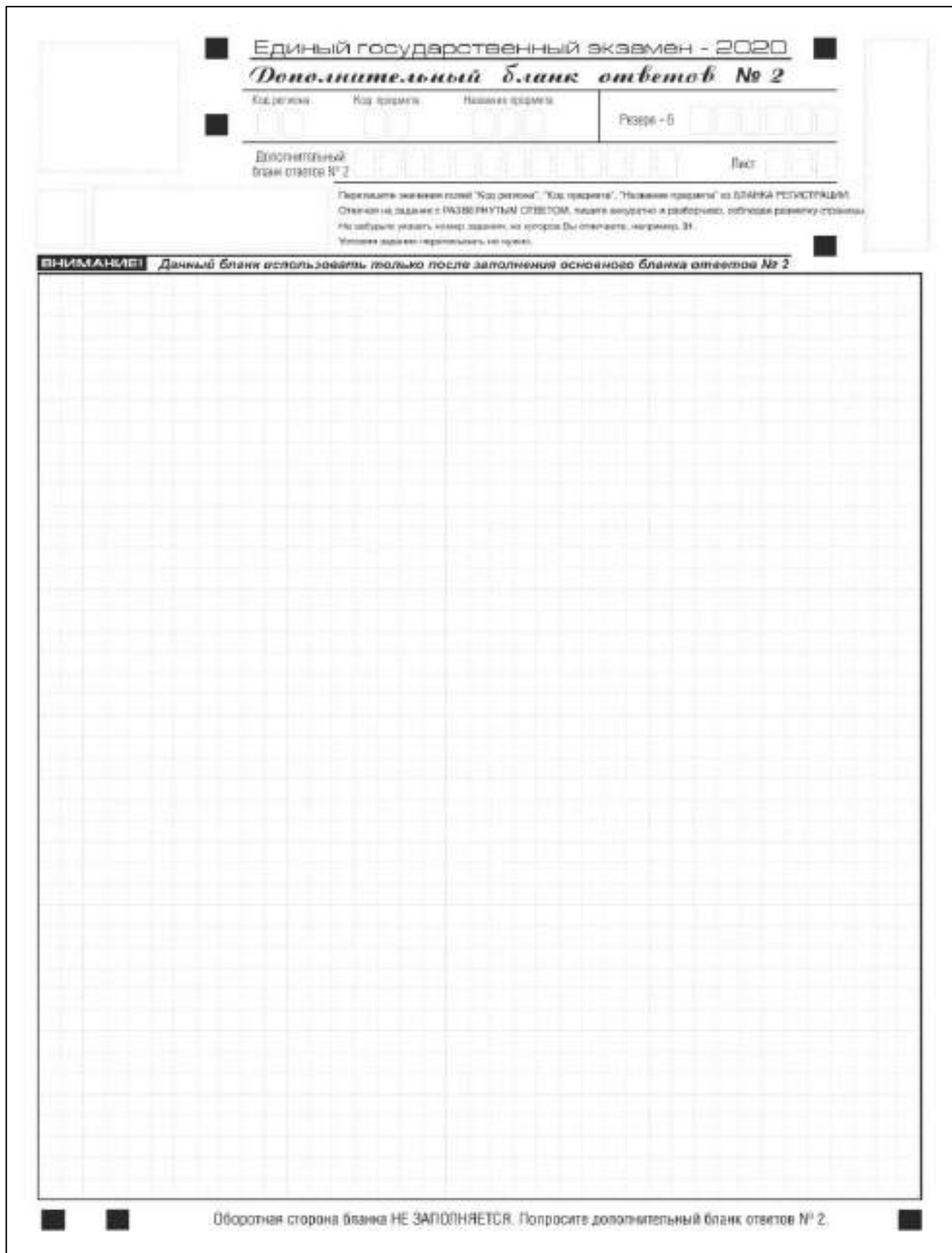
Рис. 15. Дополнительный бланк ответов № 2